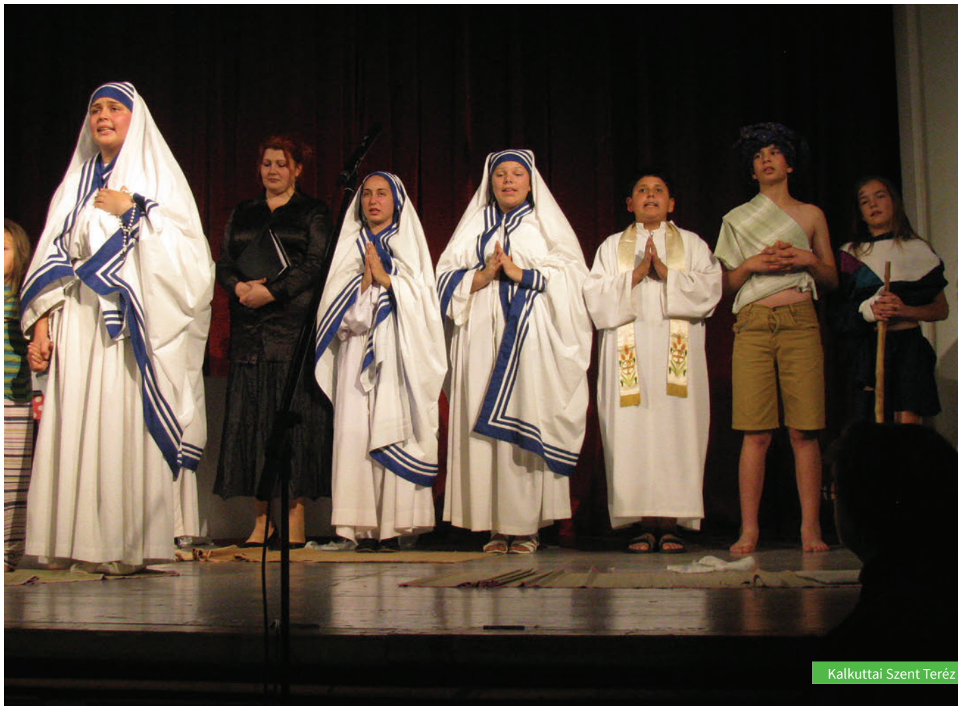
Kalkuttai Szent Teréz