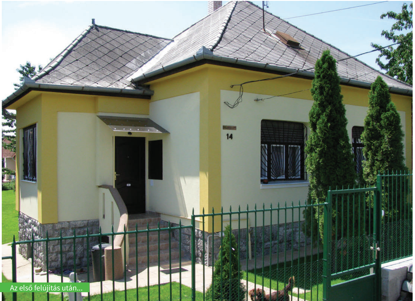
Az első felújítás után...