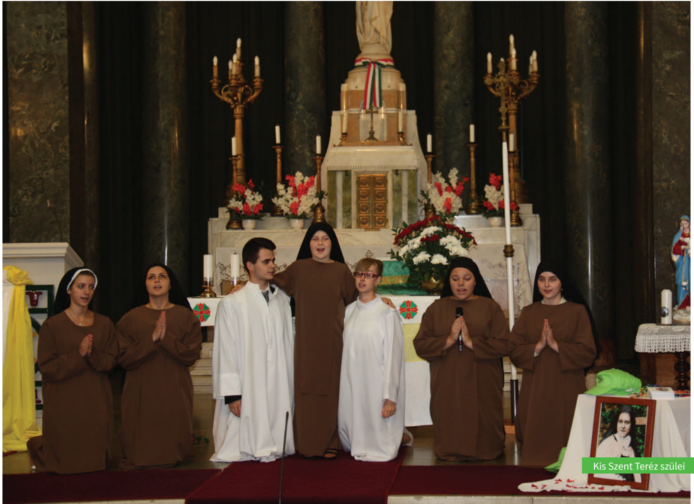
Kis Szent Teréz szülei