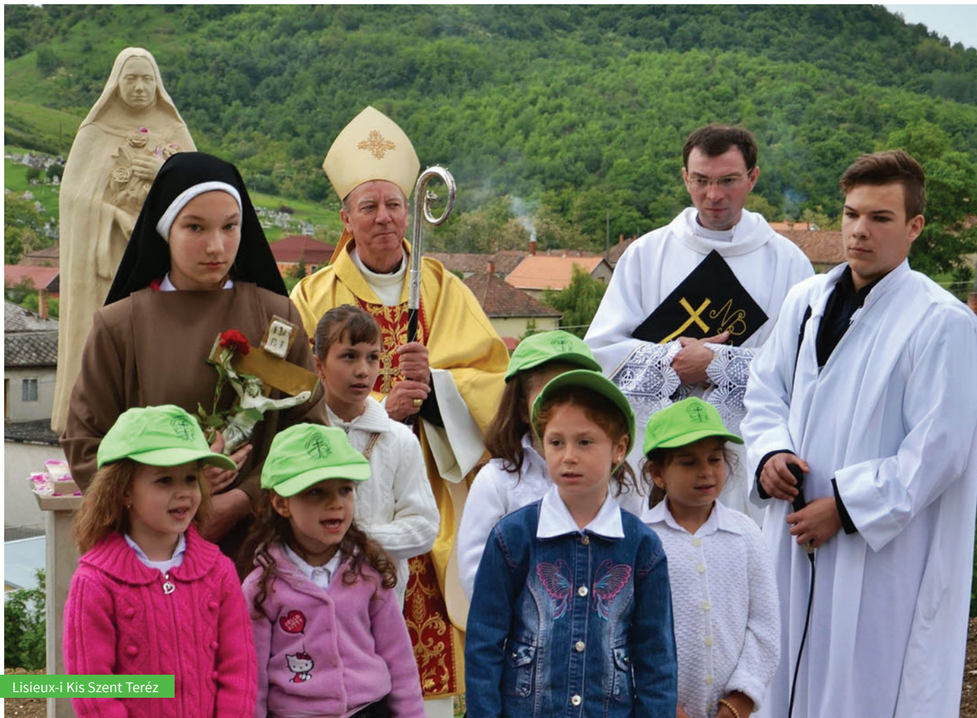
Lisieux-i Kis Szent Teréz