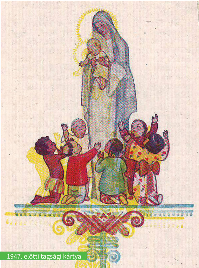
1947. előtti tagsági kártya