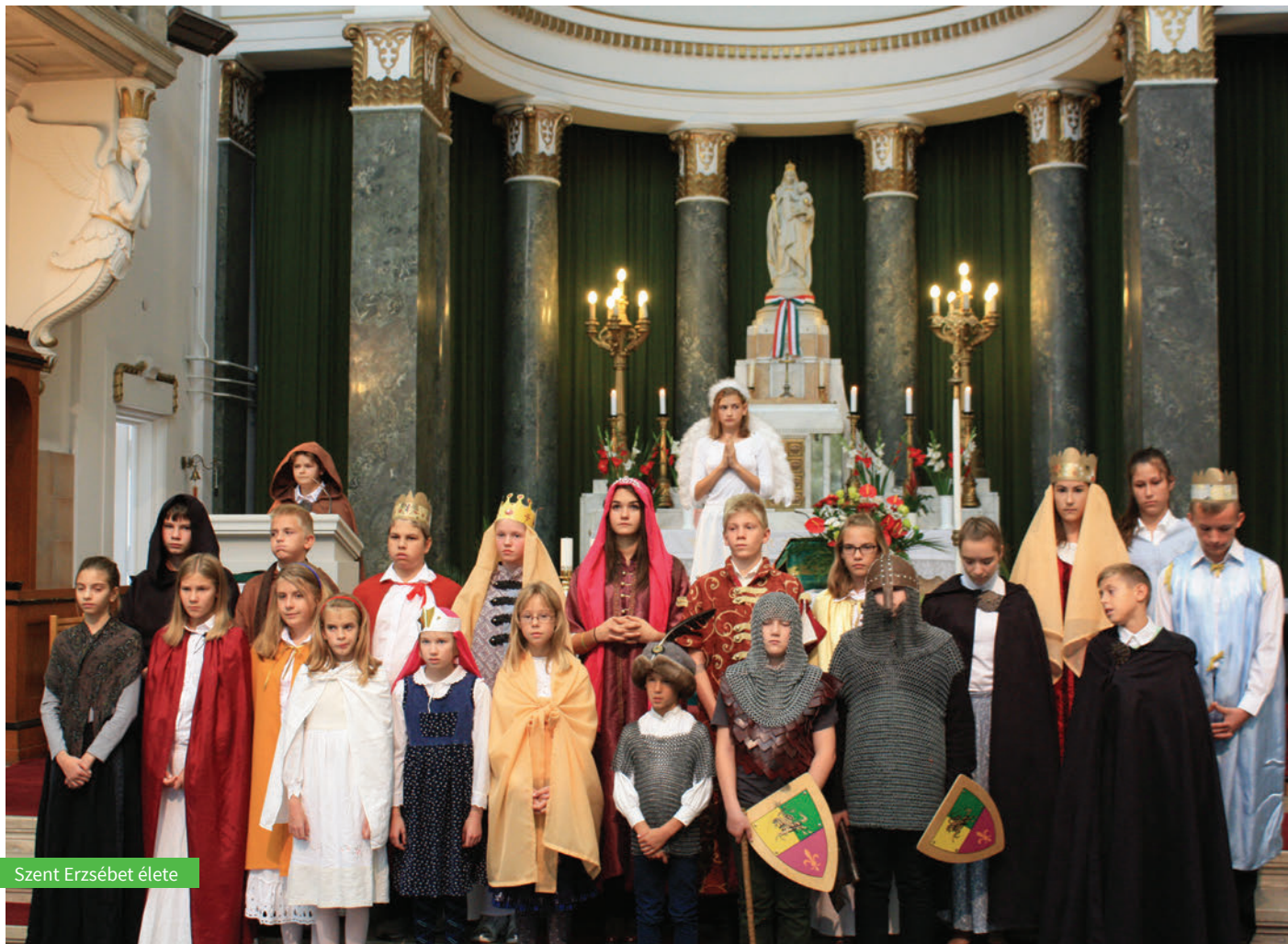
Szent Erzsébet élete