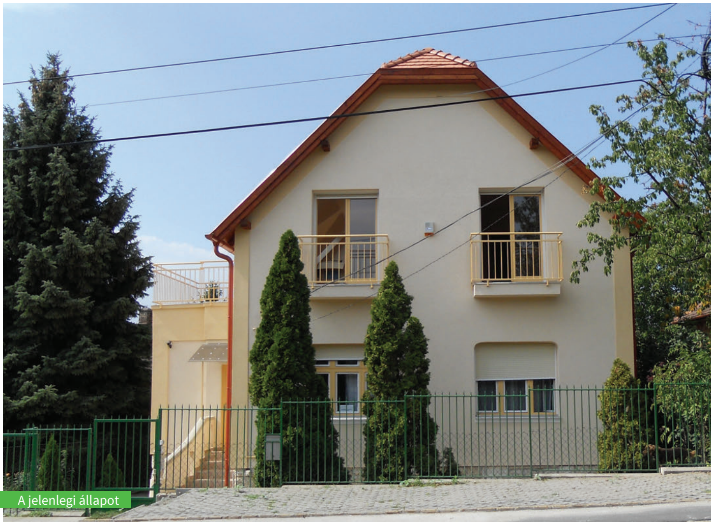
A jelenlegi állapot